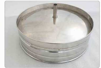
외부 통 분리