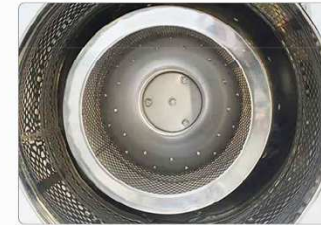
내부 통 분리